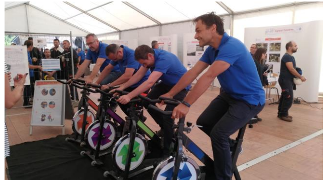
Les premiers volontaires se préparant à l'effort !

Un focus particulier a été mis sur les thématiques Environnement et Energie, afin de rappeler toutes les actions mises en œuvre. . A cette occasion, nous avons d'ailleurs fait pédaler les collaborateurs d'Ugitech pour générer quelques kWh !